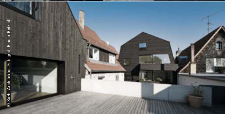
Weißes Haus, Memmingen, SoHo Architektur: Alexander Nägele spricht im Online-Seminar QUALITÄT UND INNOVATION um 14.00 Uhr